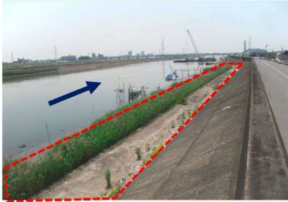
①新川：堤防耐震化工事