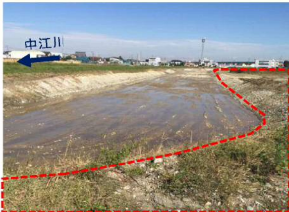
④中江川：調節池掘削工事