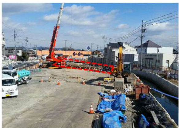
⑥青木川：県道一宮犬山線橋梁改築