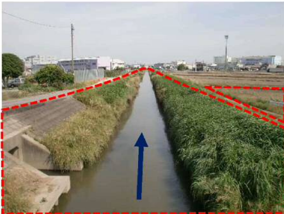
③水場川：今後の改修区間及び調節池予定地