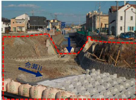
④原川：護岸工事（合瀬川合流部）