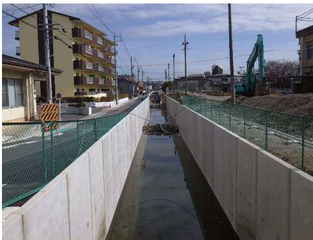
④原川：河道拡幅工事