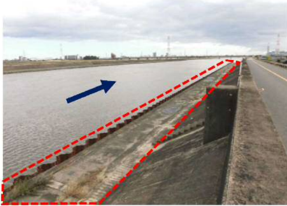
①新川：堤防耐震化工事