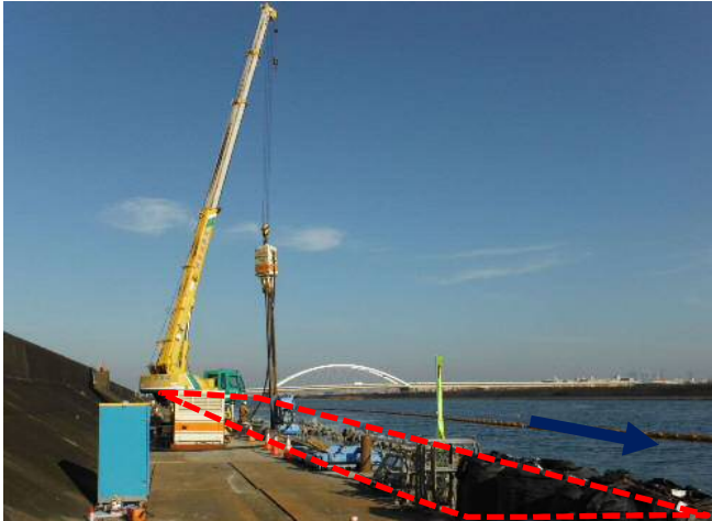
①新川：堤防耐震化工事