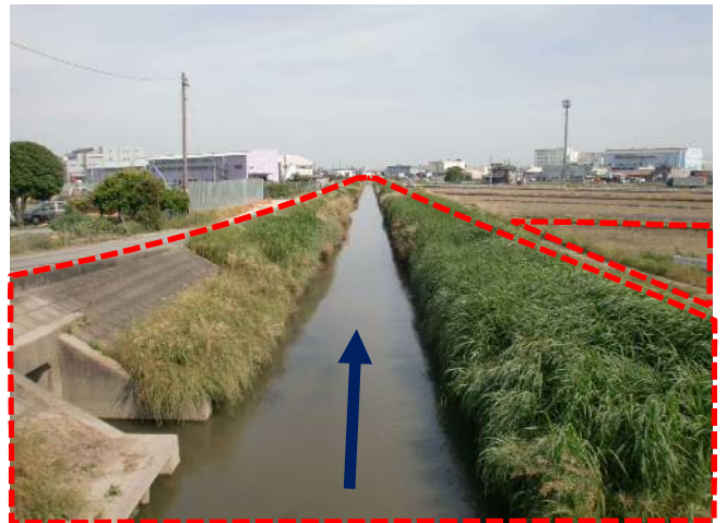
③水場川：今後の改修区間及び調節池予定地