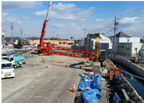
⑤青木川：県道一宮犬山線橋梁改築