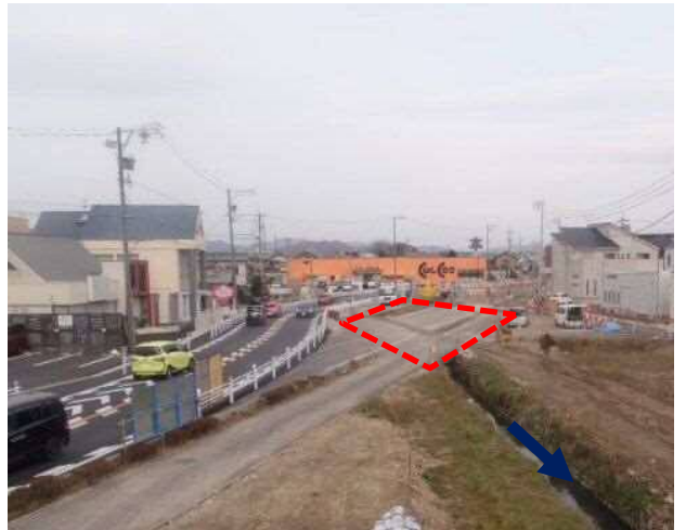
⑤青木川：県道一宮犬山線桥梁改築