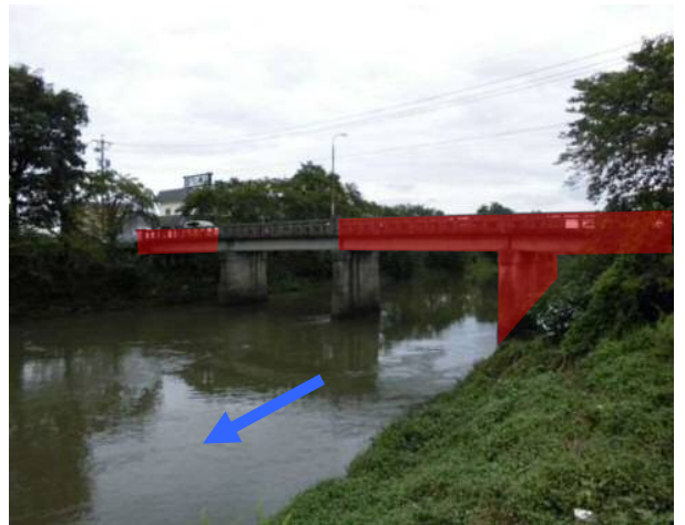
②-1五条川：船杓橋改築工事