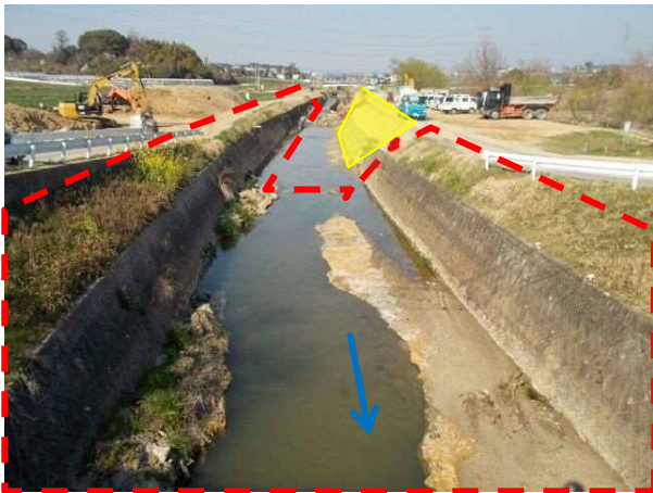
(5)逢妻男川： 護岸工実施状況