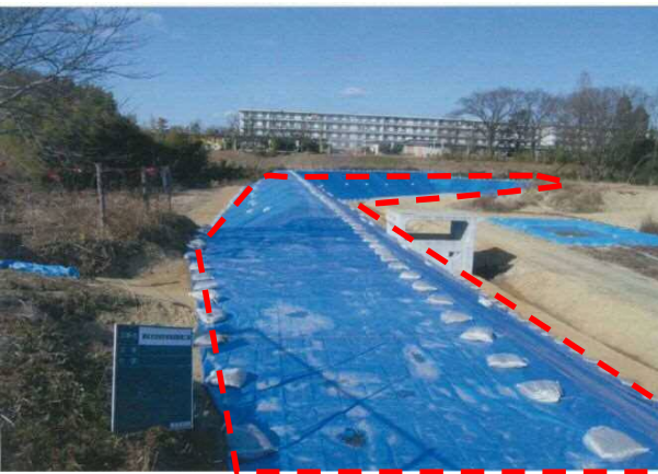
(6)頭本池 (逢妻女川)： 既存池を活用した流域貯留 (H28 は築堤工を実施)