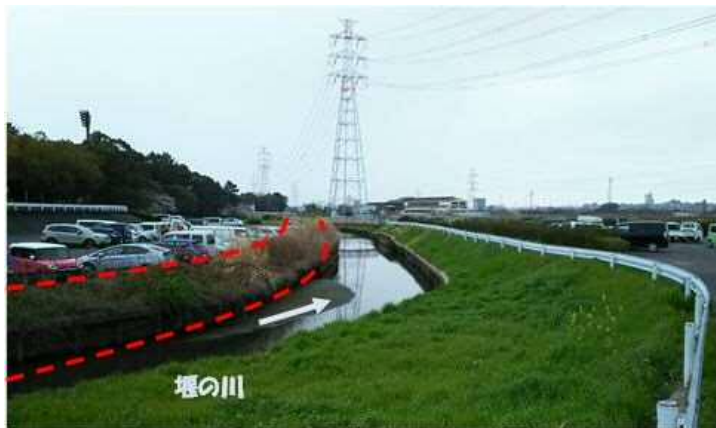
(3)逢妻川：洪水調節地 (堰の川移設)