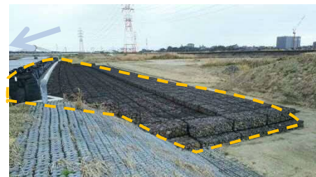
(2)逢妻川：洪水調節地 (越流堤)