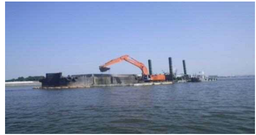
(1)境川：(H28 実施箇所) (3k000 付近)