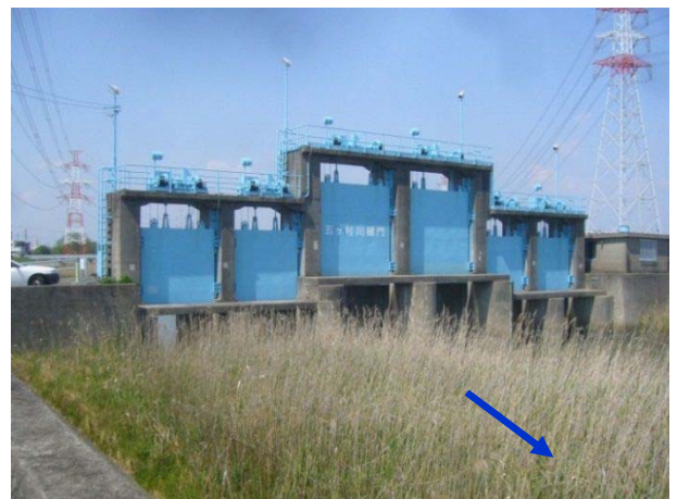
⑪五ヶ村川：昨年度に引続き、移設となる水門関連の調査・設計