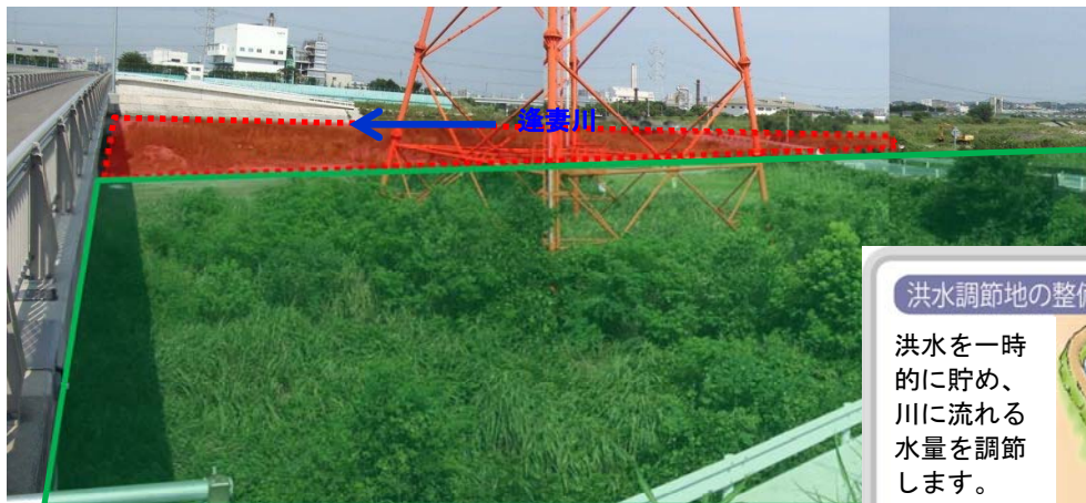
(H27 は洪水調節地整備（護岸工）を整備