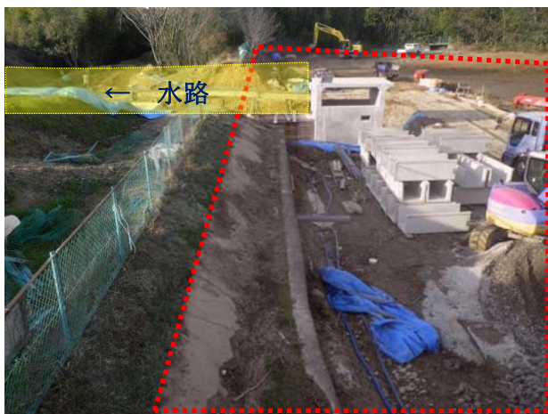
⑩頭本池（逢妻女川）：既存池を活用した流域貯留（H27 は池の堤体を整備）