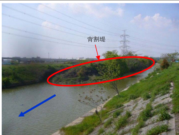
⑫五ヶ村川：河川断面を確保するために背割堤を撤去（H27 詳細設計、H28 工事着手 を予定）